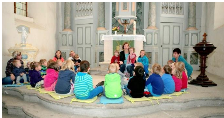
Zugegeben: Diese Kindergruppe hatte sich in der Schmannewitzer Kirche angemeldet.

Für mich ist er am Kreuz gestorben und vom Tod auferstanden.