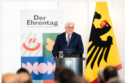
Bundespräsident Frank-Walter Steinmeier Initiator und Schirmherr des Ehrentages

Wir werten die Erfolge aus und stellen die Ergebnisse als teilbaren Content allen beteiligten Partnern und Unternehmen zur Verfügung.