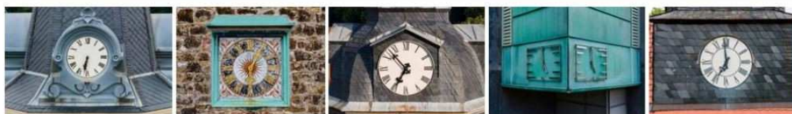
Kirchspiel-Klausur "Miteinander unser Kirchspiel in Fahrt bringen" - Herzlich willkommen!